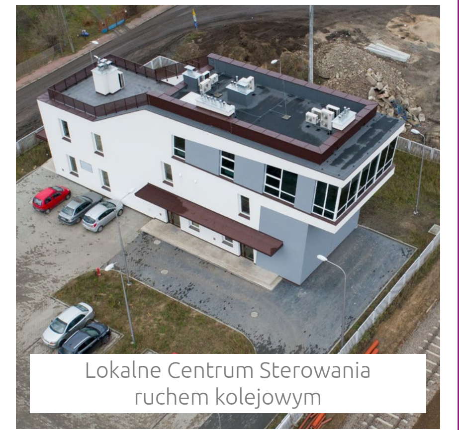
Lokalne Centrum Sterowania ruchem kolejowym

2 dwukrawędziowe perony o długości 400 metrów.