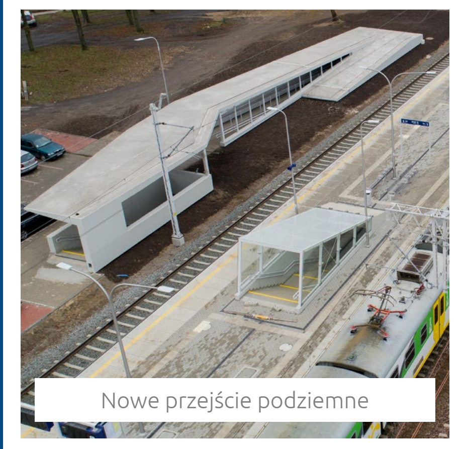
Nowe przejście podziemne