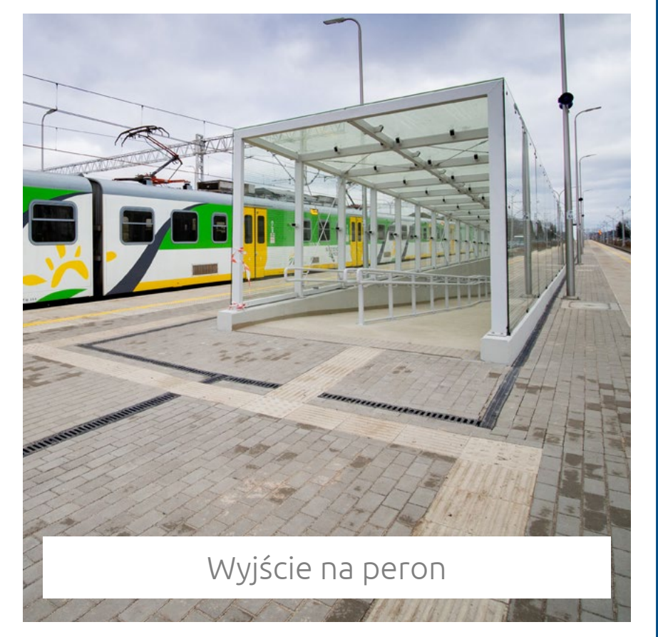
Wyjście na peron