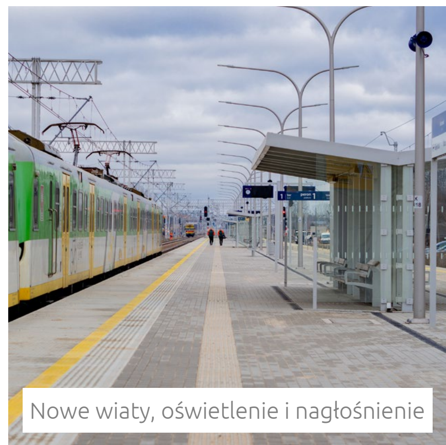
Nowe wiaty, oświetlenie i nagłośnienie