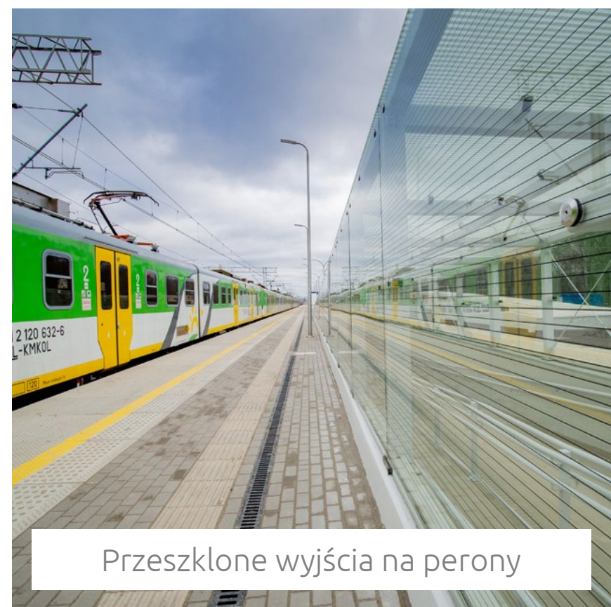
Przeszkłone wyjścia na perony